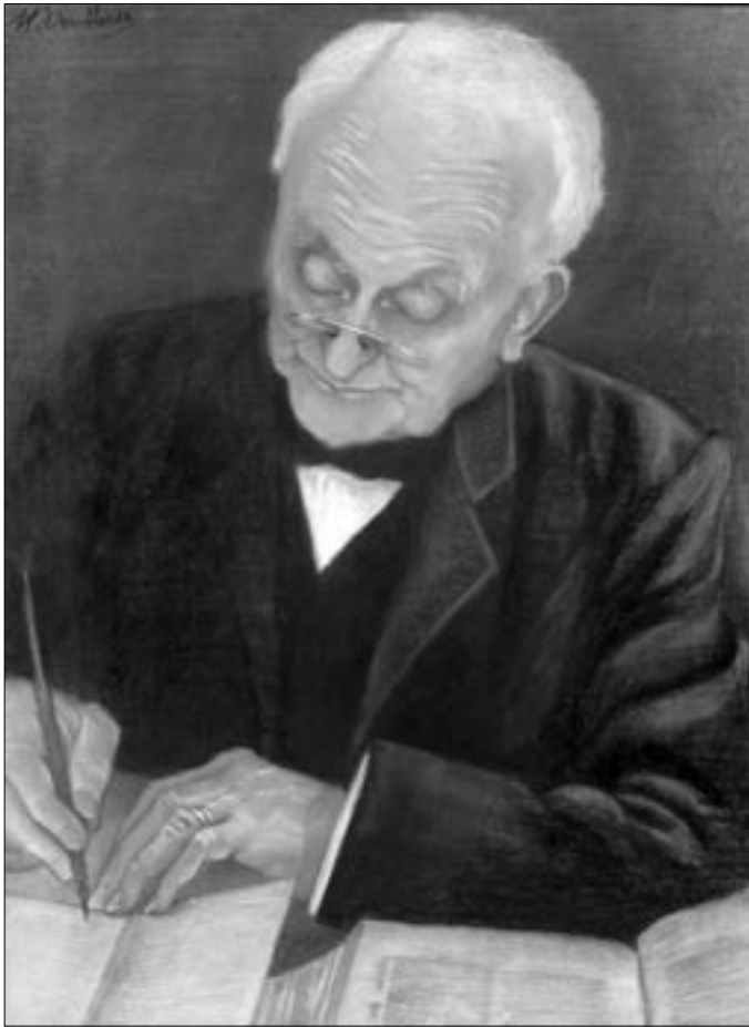
Krijttekening van Willem Hovy door Martha Voullaire (collectie Historisch Documentatiecentrum voor het Nederlands Protestantisme (1800-heden) Vrije Universiteit Amsterdam)