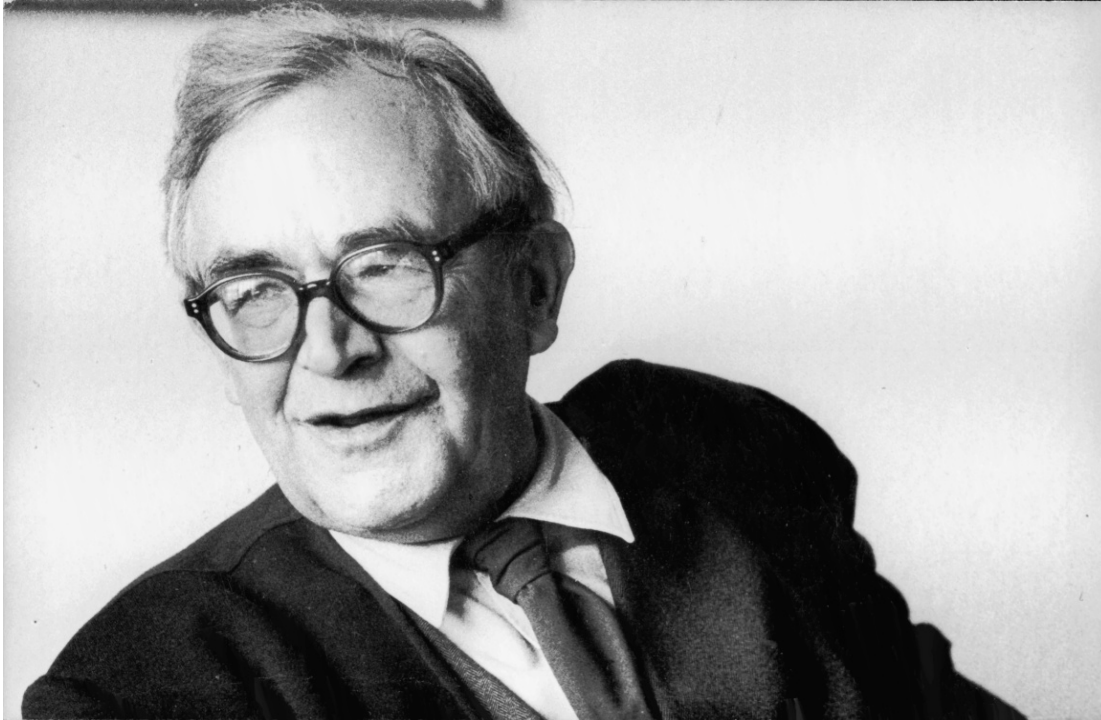
Karl Barth

hierover namelijk een artikel gestaan, dat gretig werd geciteerd door andere dagbladen. Hierin werd de schijn gewekt dat Grosheide het veto had uitgesproken over de in Amsterdam gestelde vragen. Grosheide verdedigt zijn optreden, maar wenst niet de publiciteit op te zoeken, er is volgens hem al genoeg geschreven en gezegd over Barths optreden in Nederland. 59 Grosheide meende dat zijn garantstelling dat er geen politieke discussie op gang zou komen, voorwaarde was voor de komst van Barth. Uiteindelijk heeft niemand Barth tegengehouden te spreken, maar wenste Barth zelf niet meer te spreken "...wanneer hij niet volkomen vrij was." 60 Slotemaker zelf hield in Woord en Geest een beschouwing over deze kwestie. Het 'muilkorven' van Barth was een waarschuwing voor wat de overheid in de toekomst voor censuur zou kunnen toepassen, tenzij de natie en de kerk in opstand zou komen tegen deze gang van zaken. 61